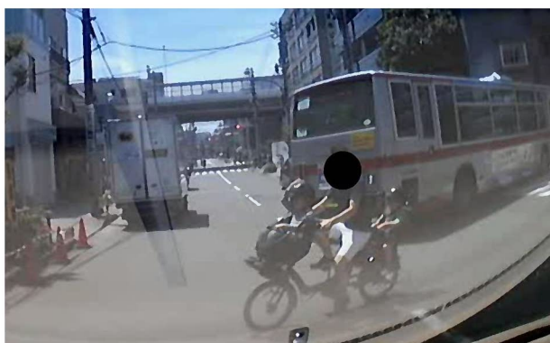
図1 交差点優先通行妨害

(道路交通法第36条) 交通整理の行われていない交差点では、交差道路の左方から進行してくる車両等の進行妨害をしてはならない。