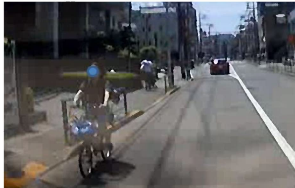
図2 通行区分違反(右側通行)

(道路交通法第17条) 道路では車両(自転車を含む)は左側を通行しなければならない。