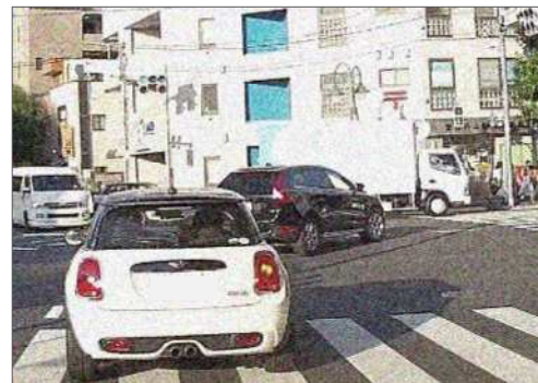
危険に満ちた右折シーン

右折は、運転の中でも、特に注意を要する難しい行動です。この右折に、多くのドライバーが、初心者のころは大変緊張したにも関わらず慣れが生じると、いつしか、その危険性を過小評価するようになってはいないでしょうか。今号は、重大事故が後を絶たない右折について、改めてその危険性や走行の基本などを取りあげましたので、是非、自身の「右折」行動をチェックする参考としてください。